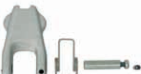
kovová pojistka pro AWH / kovová poistka pre AWH