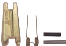
kovaná pojistka / kovaná poistka