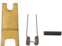
kovová pojistka pro GKHSW kovová poistka pre GKHSW