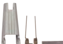
lisovaná pojistka z ocelového plechu / lisovaná poistka z ocelového plechu